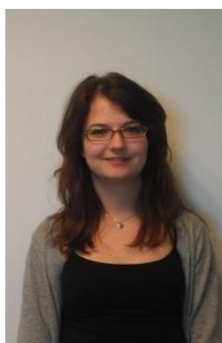
Trine Wind Suppleant Ungdomsgruppen